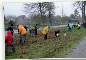
Gemeinsame Pflanzaktion im Rahmen des bundesweiten Pflanzwettbewerbs

Unser Deutschland summt! -Team mobilisiert unermüdlich die Menschen - jung und alt, groß und klein - sich für den Schutz von Wild- und Honigbienen einzusetzen. Im Rahmen von verschiedenen Garten- und Pflanzwettbewerben überzeugen wir die Bevölkerung davon, dass Pflanzaktionen pflegeleichte und schöne Lebensräume erzeugen, die Menschen zusammenschweißt und die viel Freude bereiten. Auch für die Bienen.