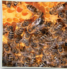
Honigbienen auf Wabe

Die Initiative Deutschland summt! Wir tun was für Bienen stärkt die Aufmerksamkeit gegenüber der Honigbiene und kümmert sich ebenfalls gleichzeitig um die anderen 584 bei uns heimischen Bienenarten: Sandbienen, Seidenbienen, Furchenbienen, Hosenbienen, Blattschneiderbienen u.v.m.