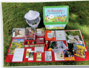
Der Inhalt unseres Bienenkoffers