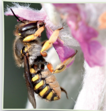
Wollbiene beim Nektartrinken

Es gibt weltweit nur neun Honigbienenarten – aber mehr als 20.000 Wildbienenarten. Die Bestäubungsleistung dieser kleinen Insekten ist immens. Doch leider ist in Deutschland die Hälfte der Wildbienenarten vom Aussterben bedroht! Sie benötigen ganz besonders unsere Hilfe!