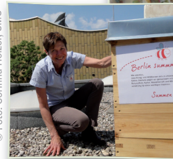
Berlin summt! - Imkerin auf dem Dach des Musikinstrumentenmuseums in Berlin