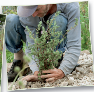
Kleine Zeichen für die Natur