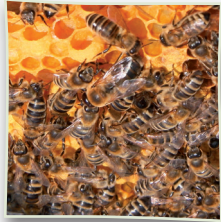
Honigbienen auf Wabe

Die Initiative Deutschland summt! Wir tun was für Bienen stärkt die Aufmerksamkeit gegenüber der Honigbiene und kümmert sich ebenfalls gleichzeitig um die anderen 580 bei uns heimischen Bienenarten: Sandbienen, Seidenbienen, Furchenbienen, Hosenbienen, Blattschneiderbienen u.v.m.