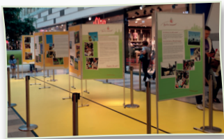
Die Berliner Wanderausstellung in Spandau

Mit den drei Wanderausstellungen in den Städten Berlin, Hamburg und Frankfurt am Main geben wir einen Einblick in die Welt der (Wild-)bienen und erläutern, wie ein bienenfreundlicher Garten aussieht.