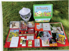
Der Inhalt unseres Bienenkoffers

Wir haben zwei „Bienenkoffer“ für Pädagogen und Erzieherinnen erstellt: einen für Kitakinder (3 - 6 Jahre) und einen für Grundschulkinder (7 - 12 Jahre).