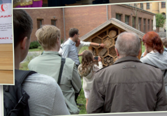
Berlin summt! - Imkerin auf dem Dach des Musikinstrumentenmuseums in Berlin